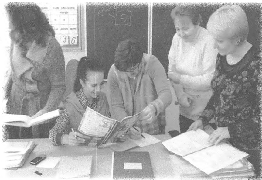
Работа школы молодого педагога

Молодой педагог – это, в первую очередь, Личность, сформировавшаяся, со своими взглядами и убеждениями. Но является ли этот человек сформировавшимся педагогом? Ответ очевиден – нет. Поэтому с первых дней его появления в школе необходима помощь и поддержка коллег. В нашем учреждении образования – это работа школы молодого педагога.